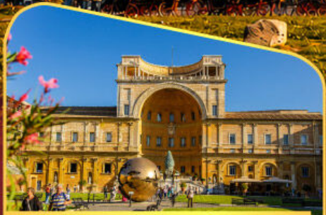
เข้าชมพีพีรภัณฑทวาทิกัน