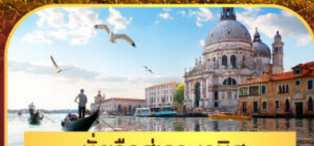
นั่งเรือสุทวาทะเวนิส