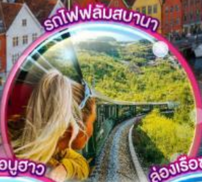
รถไฟฟลัมสบานา