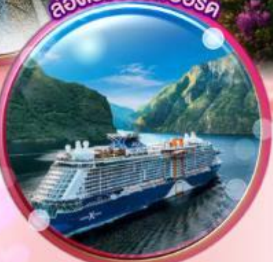
ล่องเรือของเฟอร์ด์