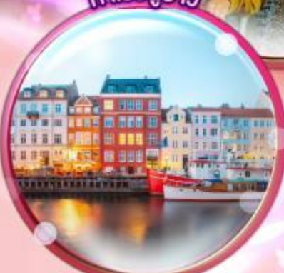
ท่าเรือบูชาว