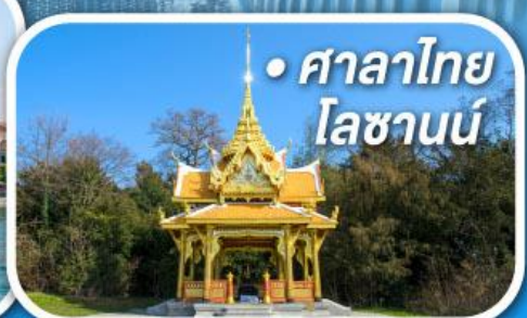
• ศาลาไทย โลซานน์

• สุดอากาศดีที่เซอร์แมท • ขึ้นกระเช้าสู่ยอดจากกลาเซียร์ 3000 • ชมเมืองคลาสสิกเบิร์น ลูเซิร์น ซูริก