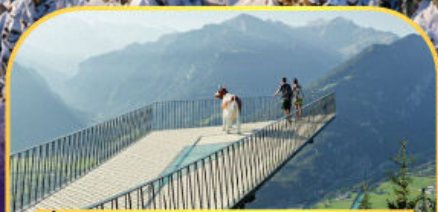
นั่งรถกระเช้าไฟฟ้า ชาร์เตอร์ คูส์ม