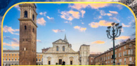
ถ่ายภาพกับมหาวิหารตูริน