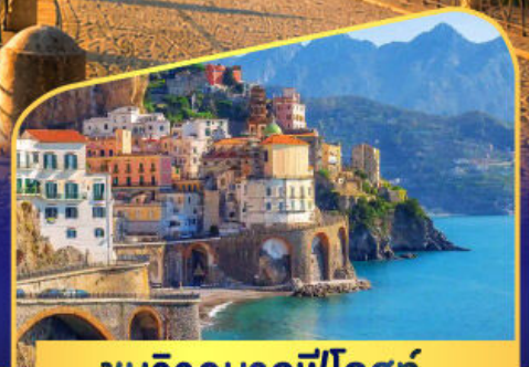
ชมวิวมอลฟีโคสก์