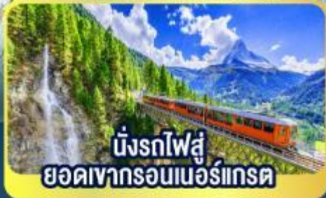
นั่งรถไฟสู่ ยอดเขารอนเนอร์เกรด