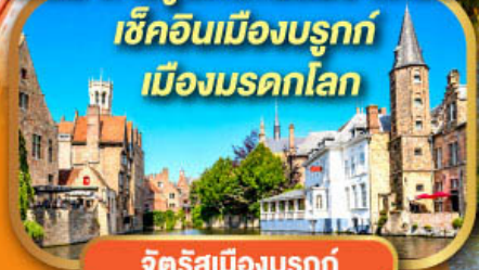
จัตุรัสเมืองบรูคซ์