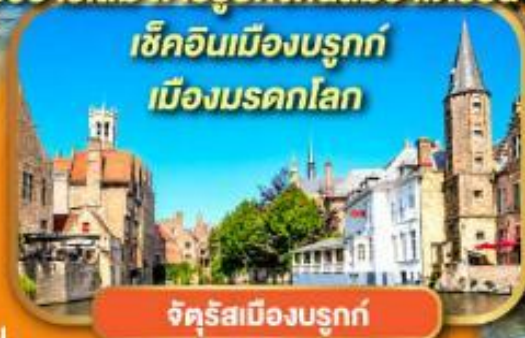
จัตุรัสเมืองบรูกก์