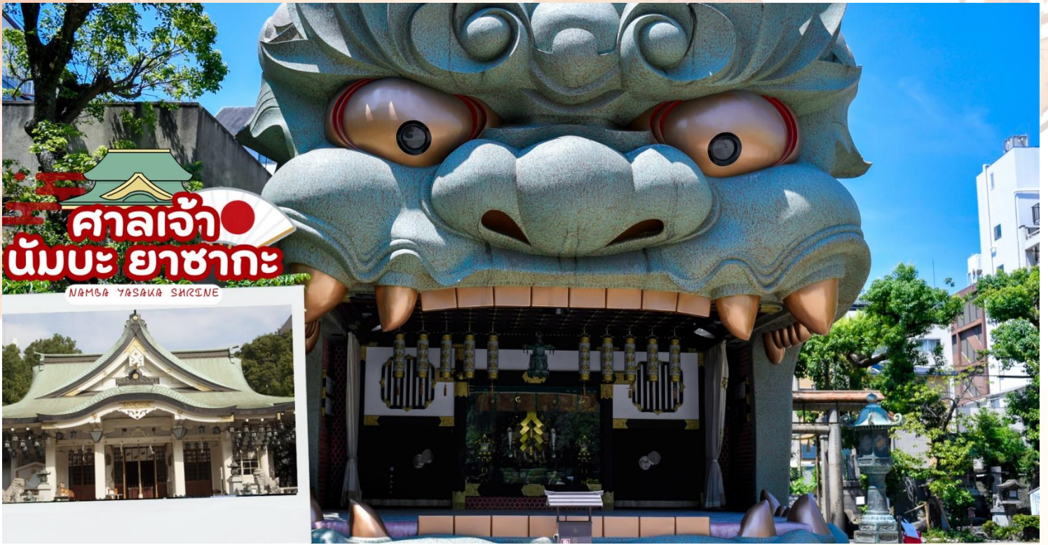
ศาลเจ้า นัมเบะ ยาชากะ NIMBLE YASHAKA SHRINE

พาท่าน ช้อปปิ้งโดตงโบริ (Dotonbori) นั้น ถือว่าเป็นแหล่งช้อปปิ้งที่มีชื่อเสียงมากที่สุดในจังหวัดโอซาก้า และยังถือเป็นแหล่งช้อปปิ้งที่มีความโรแมนติกอีกด้วย เพราะย่านโดตงโบริที่เป็นแหล่งช้อปปิ้งนั้น ไม่ได้มีขนาดใหญ่เหมือนกับแหล่งช้อปปิ้งที่อื่นๆ จะเป็นเพียงถนนสายเล็กๆ ที่อยู่เลียบบคลองโดตงโบริ ในช่วงเย็นๆของถนนสายนี้จะดูคึกคัก เต็มไปด้วยแสงสี และเสียงจากป้ายไฟโฆษณาต่างๆ ที่อยู่ทั้งบนตึก และริมแม่น้ำ ผู้คนส่วนใหญ่ที่เป็นนักท่องเที่ยวต่างชาติ และชาวญี่ปุ่นเอง จะมาเดินช้อปปิ้ง มาทานอาหารเพื่อตีความกับบรรยากาศแบบนี้กันเป็นจำนวนมาก จุดที่พลาดไม่ได้ ของย่านโดตงโบรินี้ ก็คือ ป้ายไฟกูลิโกะ ซึ่งเป็นที่รู้จักกันอย่างมากมายบริเวณสะพานเอบิซุ