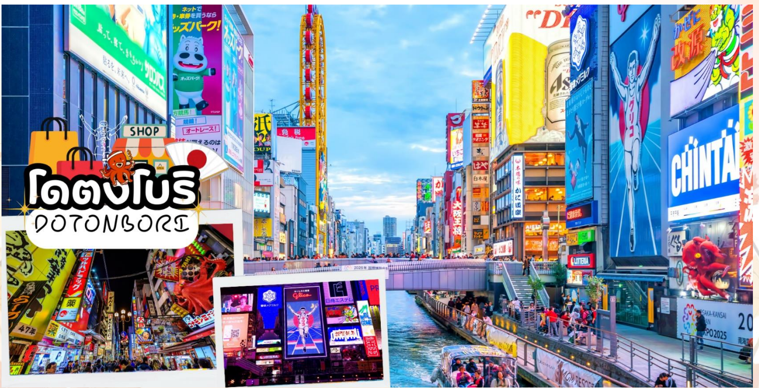
โดตงโบริ DOTOBORI

พาท่าน ช้อปปิ้งโดตงโบริ (Dotonbori) นั้น ถือว่าเป็นแหล่งช้อปปิ้งที่มีชื่อเสียงมากที่สุดในจังหวัดโอซาก้า และยังถือเป็นแหล่งช้อปปิ้งที่มีความโรแมนติกอีกด้วย เพราะย่านโดตงโบริที่เป็นแหล่งช้อปปิ้งนั้น ไม่ได้มีขนาดใหญ่เหมือนกับแหล่งช้อปปิ้งที่อื่นๆ จะเป็นเพียงถนนสายเล็กๆ ที่อยู่เลียบบคลองโดตงโบริ ในช่วงเย็นๆของถนนสายนี้จะดูคึกคัก เต็มไปด้วยแสงสี และเสียงจากป้ายไฟโฆษณาต่างๆ ที่อยู่ทั้งบนตึก และริมแม่น้ำ ผู้คนส่วนใหญ่ที่เป็นนักท่องเที่ยวต่างชาติ และชาวญี่ปุ่นเอง จะมาเดินช้อปปิ้ง มาทานอาหารเพื่อตีความกับบรรยากาศแบบนี้กันเป็นจำนวนมาก จุดที่พลาดไม่ได้ ของย่านโดตงโบรินี้ ก็คือ ป้ายไฟกูลิโกะ ซึ่งเป็นที่รู้จักกันอย่างมากมายบริเวณสะพานเอบิซุ