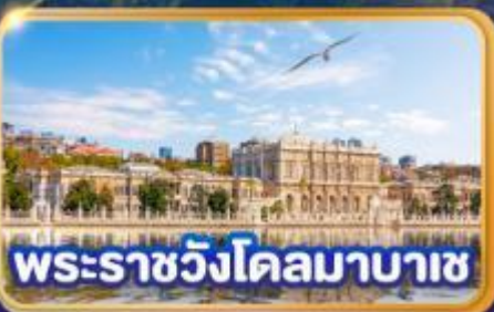
พระราชวังโดลมาบาซ