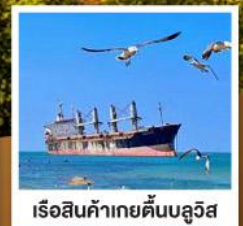
เรือสินค้าเกย์ตันบลูวิส