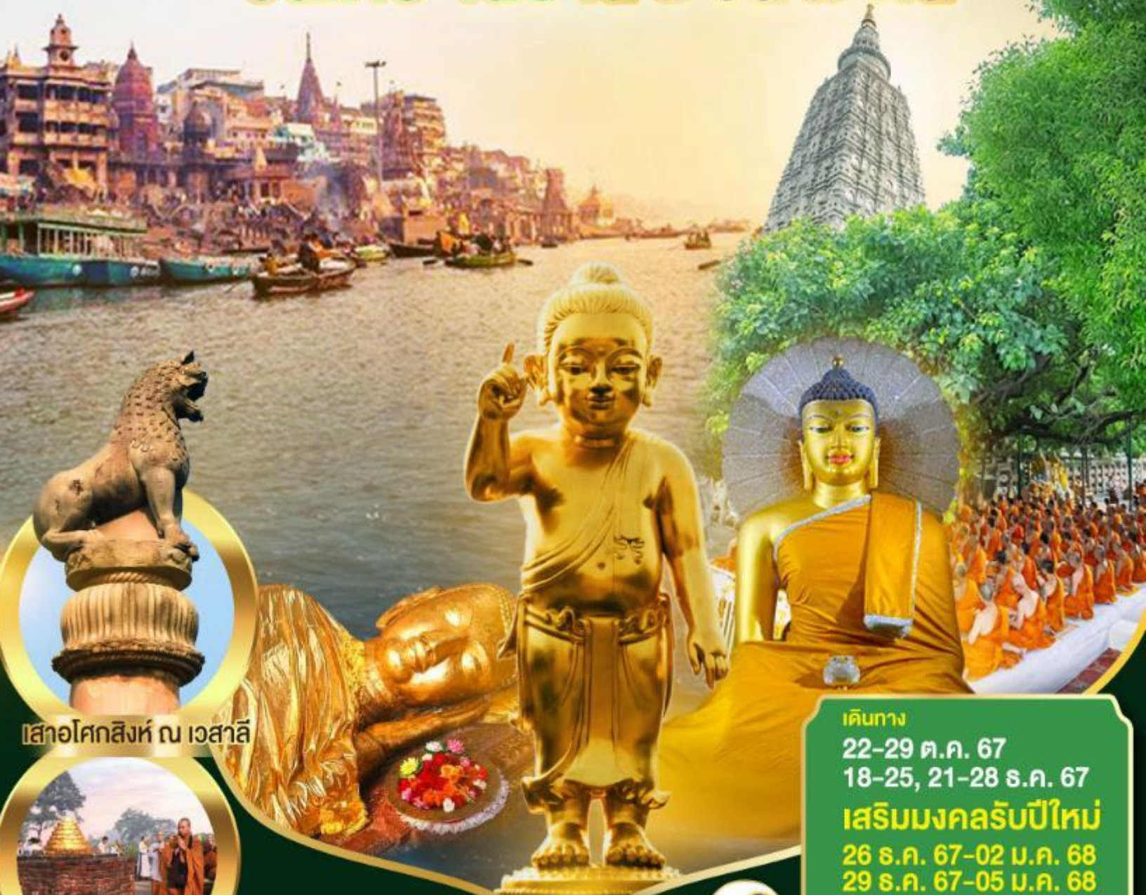
เสาอโศกสิงห์ ณ เวสาลี