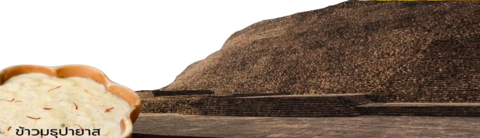
ข้าวมธุปายาส