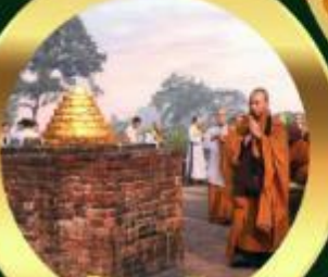
เขตวันมหาวิหาร เมืองสาวิตรี