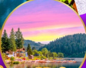
ททิเซ่ ปาดำ