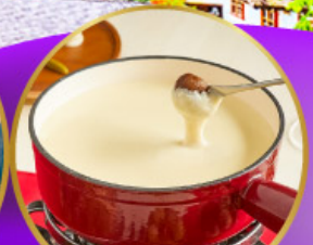
ฟองดูซีส