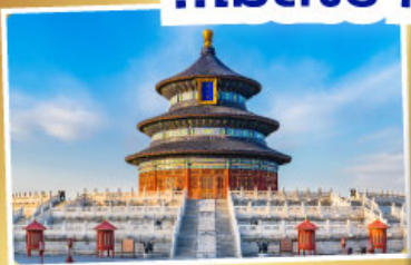
หอฟ้าเทียนถาน

จ่ายราคาเดียว..เที่ยวเต็มอิ่ม ..ไม่ลงร้านช้อปปิ้ง