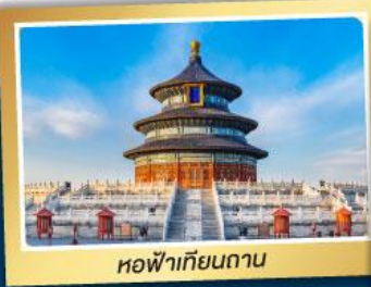
หอฟ้าเทียนถาน

จ่ายราคาเดียว..เที่ยวเต็มอิ่ม ..ไม่ลงร้านช้อปปิ้ง