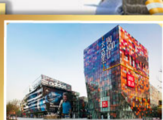
ช้อปปิ้ง SANLITUN