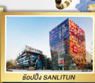
ช้อปปิ้ง SANLITUN