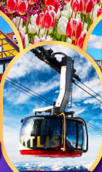
กระเช้าทิตลิส