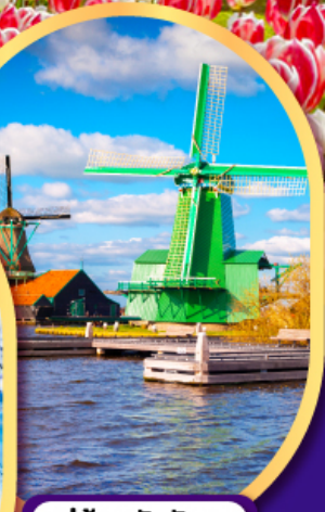
หมู่บ้านกังหันลมชาสคินส์