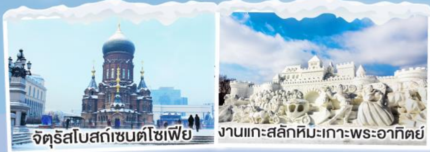
จัตุรัสโบสถ์เซนต์โซเฟีย