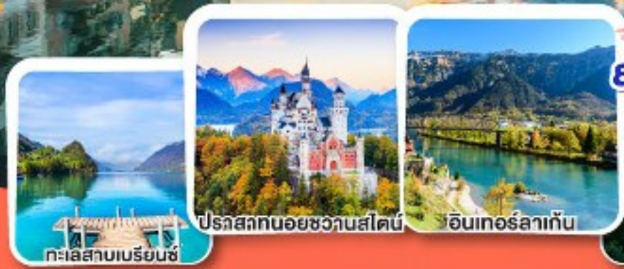
ทะเลสาบเบรียนซ์

การันตีได้ค้ำคินบน ยอดเขาริกี ราชินีแห่งขุนเขาสวิส.