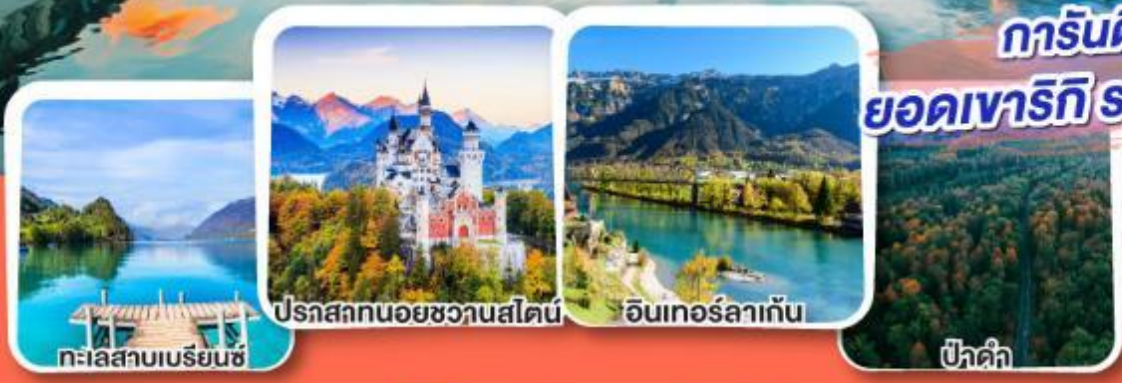
ปราสาทนอยชวานสไตน์