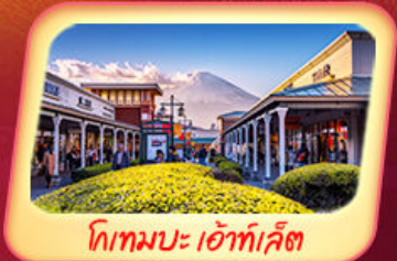
โทกเมบะ เอ้าท์เล็ต