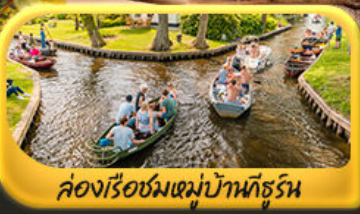
คลองเรือชมหมู่บ้านกังหัน