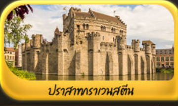
ปราสาทราเวนสตี