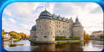
ปราสาทไอเรโบ