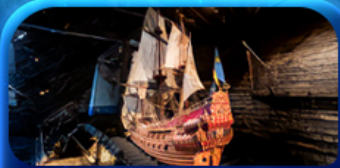
พิพิธภัณฑ์ทัวชา

Scandinavian Lover Capital Sweden Norway Denmark