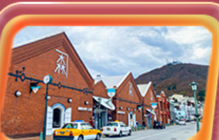
โค้งอิฐแดง

✈️ สายการบิน Thai Airways (TG) น้ำหนักกระเป๋า 23 KG