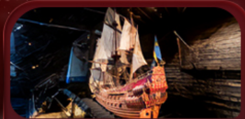
พิพิธภัณฑ์วีกา