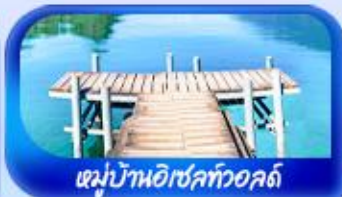
หมู่บ้านอิเซลทอวอลด์