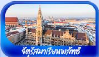
จัตุรัสมาเรียเนพลิกซ์