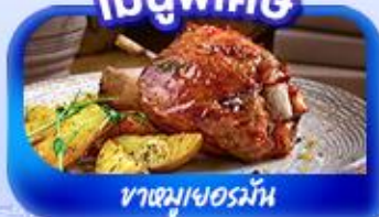
ขาหมูเยอรมัน