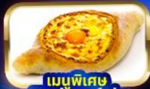
เมนูพิเศษ พิซซาจอร์เจีย Khachapuri

การ์นิตี 15 ท่านออกเดินทาง พร้อมหัวหน้าทัวร์คนไทย