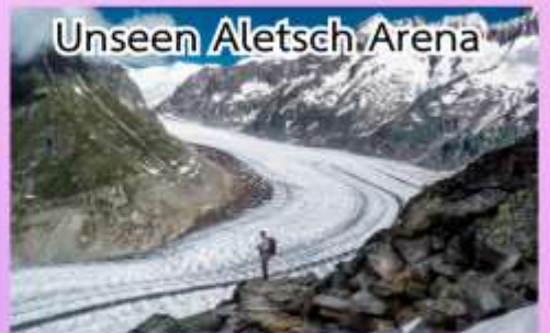
Unseen Aletsch Arena

ชมความงดงามของทะเลสาบเจนีวา ชมปราสาทชิลองที่เมืองมอว์คเทอซ ล่องเรือชมความงามของทะเลสาบลูเซิร์น, พักในหมู่บ้านเซอร์แมท (เมืองตากอากาศปลอดมลพิษ ที่ได้ชื่อว่าสวยงามเหมือนสวรรค์บนดิน)