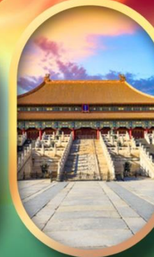
พระราชวังกุ๊กง