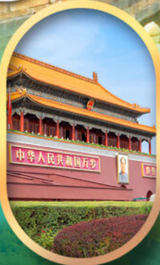
จัสดริสเทียนอันเหมิน