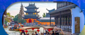
Zhujiajiao Ancient Town ล่องเรือเมืองโบราณ

เซี่ยงไฮ้ ดิสนีย์แลนด์ เมืองโบราณจูเจียเจียว