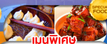
เมนูพิเศษ เสี่ยวหลงเปา หมูน้ำแดง เดินทาง ต.ค. 69 - มี.ค. 70