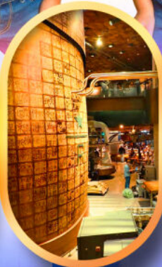
ร้านสตาร์บัคส์