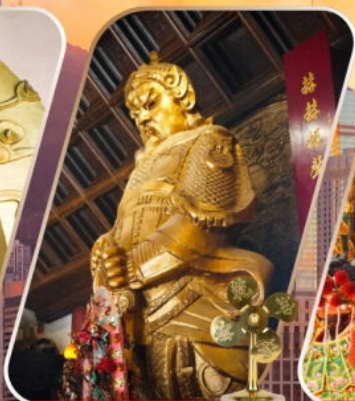
CHE KUNG (SHA TIN)