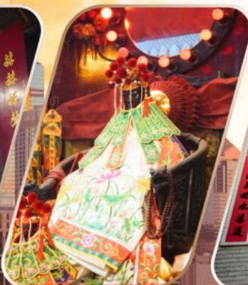
KWAN YUM HH