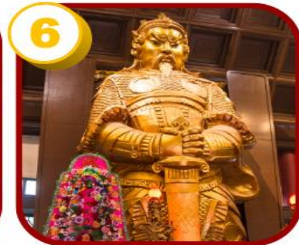
วัดแซกง (ซ่าถิ้น)