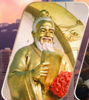
WONG TAI SIN