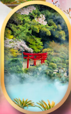
อุมิจิโกกุ