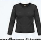
สวมฮีทเทค (Heattech) แบบหนาพิเศษด้านใน