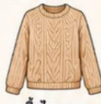
เสื้อไหมพรม