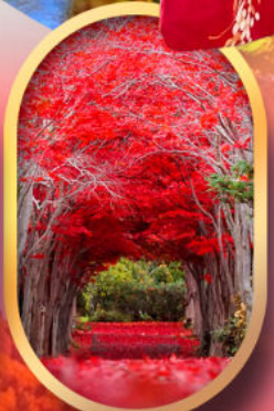
สวนฮิราโอกะ