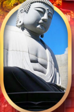
พระใหญ่อะตะมะ