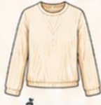
เสื้อแขนยาว