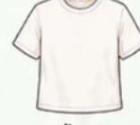
เสื้อยืด