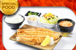
เมนูพิเศษ Set ปลาซอกเกะ