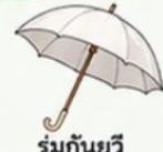
ร่มกันยูวี