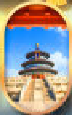
ศาลเจ้าฟ้าดินแดน