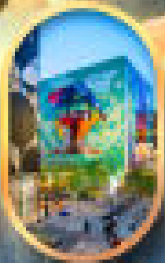
ย่านชานเมือง