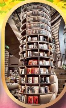
อุทยานปีติงโกว