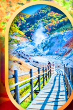
ทิวทัศน์เมือง