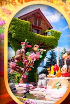
สวนสาธารณะ