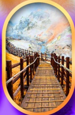
จิกุคคาบิ