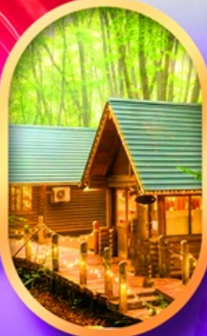
นิงเกิ้ลทอเรียส