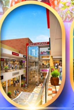
มิตซุยาอ๋ามิเลียต