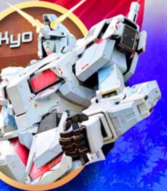
ห้างไอโดบะกันดั้ม