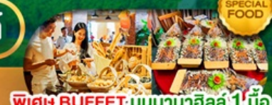
พิเศษ BUFFET; บันบานาฮิลล์ 1 มื้อ และ SEAFOOD BOAT เดินทาง มี.ค. - ต.ค. 69