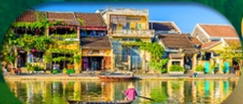
HoiAn Ancient Town ย่านเมืองเก่าฮอยอัน