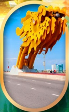
สปาวันมังกรดานัง