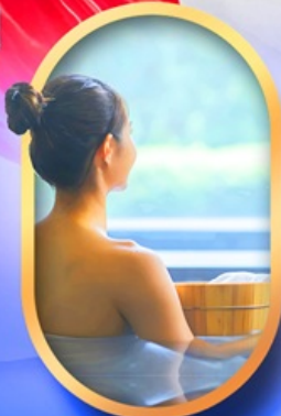
พักรัองแรมออนเซ็น