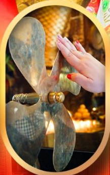
หมอนกั๊กหันแซง