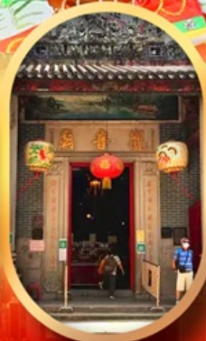
เจ้าแม่กวนอิมสองอ่า