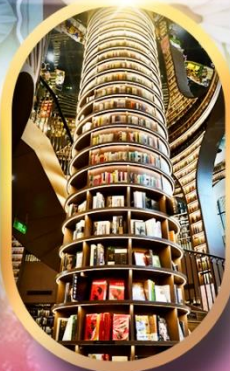
หอหนังสือจิงซูเก๋อ