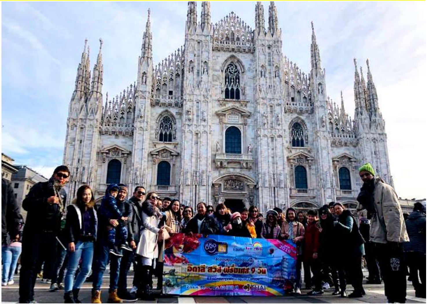
อิตาลี-สวิสเซอร์แลนด์-ฝรั่งเศส 9วัน TG PROMOTION4 เดินทางปีใหม่ 25ธ.ค.-02ม.ค.2562(จำนวน32ท่าน)