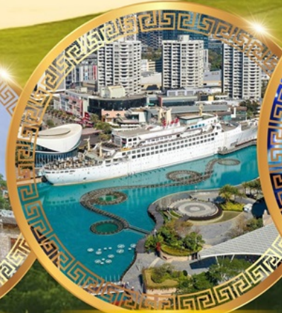
ท่าเรือ Sea World