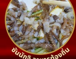
ชั้นนักจิว อาหารท้องถิ่น