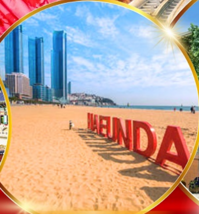
หาดแฮนแด