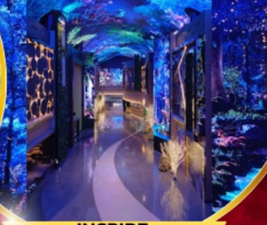
คาเฟ่ดัง Forest Outing