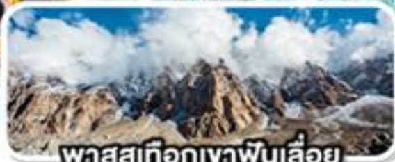
พาสูเทือกเขาพินเลื่อย

เดินทาง 08-16 ก.พ. 68 (วันวาเลนไทน์, วันมาฆบูชา)