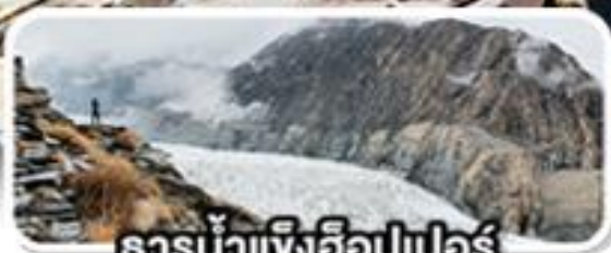
ธารน้ำแข็งอ็อปเปอร์