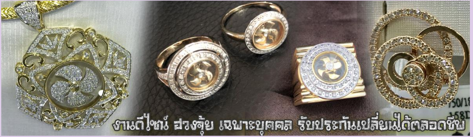
งานตีทอง สวยจุก๊วย เจาะบุคคล รับประกันเปลี่ยนไม่ตัดลดชิ้น

เที่ยง รับประทานอาหารกลางวัน ณ กัณฑ์ดาตาร ***เมนูท่านอย่างฮ่องกงแสนอร่อย***