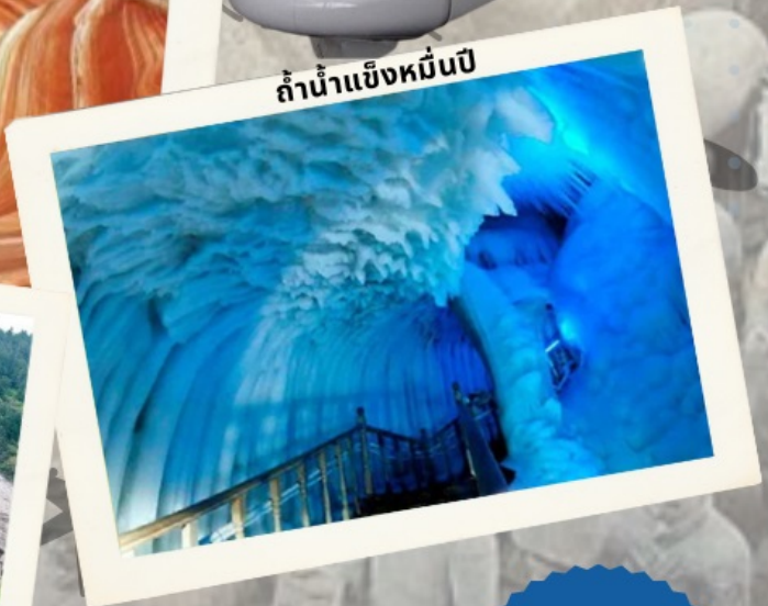
ถ้ำน้ำแข็งหมื่นปี