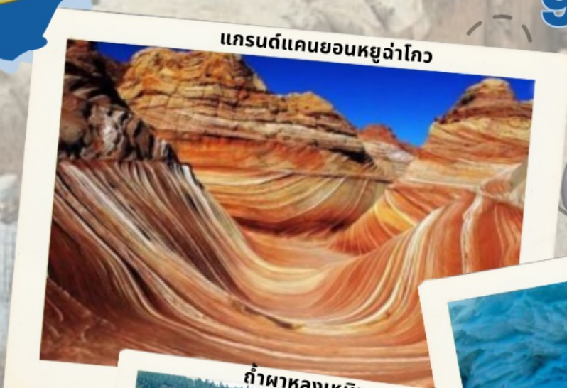
แกรนด์แคนยอนหยูฉ่าโกว