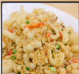
หมึกทอดกระเทียม