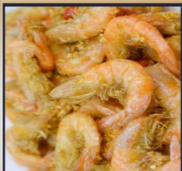
กุ้งทอดกระเทียม