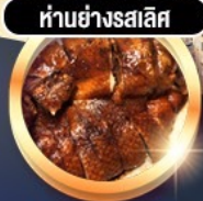
हांอย่างรสเลิศ