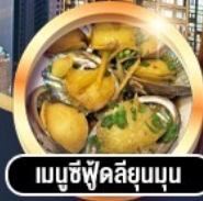
เมนูซีฟู้ดลิ้นยุมนุ่ม