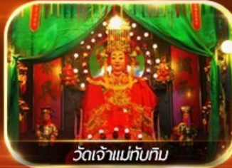
วัดเจ้าแม่ทับทิม