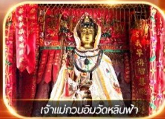
เจ้าแม่กวนอิมวัดหลินฟ้า