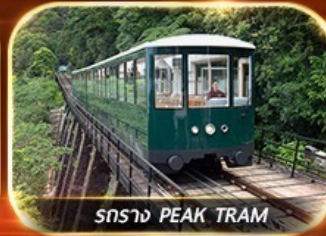
รถราง PEAK TRAM

รวมตั๋วดิสนีย์แลนด์+รถรับ-ส่ง ซอปปิงแบบจัดเต็ม พักย่านจิมซาจุ่ย