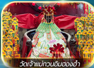
วัดเจ้าแม่ทวนอิมสองอ่า