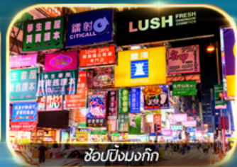
ช้อปปิ้งมอลล์

เต็มอิ่มทั้งบุญ และ ช้อปปิ้งแบบจัดเต็ม จิมซาจู้ย มงก๊ก เกาะฮ่องกง ชมวิวอ่าววิคตอเรีย วัดเจ้าแม่ทับทิม เจ้าแม่ทวนอิม หาดริพัลส์เบย์ วัดหลินฟา โรงงานจิวเวอร์รี่