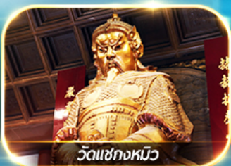
วัดเขากงหมิว