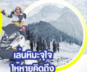
เล่นหิมะ-จิว ให้หายคิดถึง