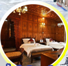
บ้านเรือ..วิมานบนดิน