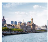
หาดว่อกาน