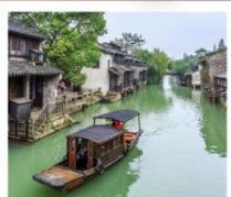
หมู่บ้านจูเจียเจียว