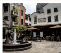
ซินเทียนตี้